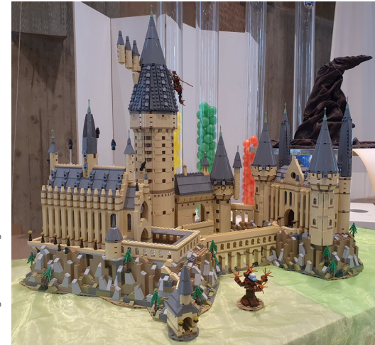
Foto: Lego-Schloss Hogwarts