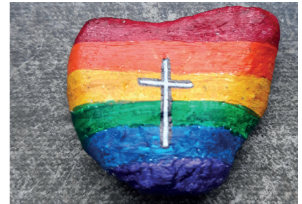
Osterstein, Foto: privat

In der neuen Konfirmandengruppe Friedenskirche-Kreuzkirche hatten wir uns am 10. März zum ersten Mal getroffen und gerade mal die Namen voneinander kennengelernt. Die neue, speziell für die Konfirmandenarbeit entwickelte KonApp hat uns geholfen, weiter in Verbindung zu bleiben. So konnten sich die Gruppenmitglieder mit ein paar Sätzen zu ihren Hobbies und ihren Stärken etwas kennenlernen. Bei einem weiteren Treffen mit der KonApp haben wir uns mit Ostern beschäftigt. Mit dem Film „Sengelmann sucht Ostern“ haben die Konfis einiges über die Karwoche und das Osterfest gelernt. Beim nächsten digitalen Zusammentreffen gab es die Aufgabe, glatte Steine zu sammeln und als Ostersteine