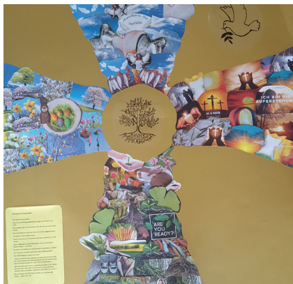
Spaziergangsmeditation Ostern

Spaziergang diese Bilder zu betrachten und so die Passionszeit und das Osterfest wahrzunehmen. So wie alte Kirchen innen mit Bildern der Bibel geschmückt sind, erschien in dieser Zeit nach außen sichtbar an den Fenstern des langen Ganges am Katharina-von-Bora-Haus an jedem Tag ein neues Bild. Gefertigt wurden die Bilder von KirchenvorsteherInnen, dem Vikar und den PfarrerInnen.