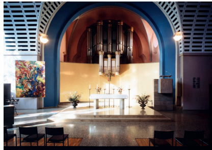
Innenraum der Friedenskirche

In der Corona-Krise hat es sich bewährt, dass wir schon seit 20 Jahren die Friedenskirche auch an Werktagen öffnen. Ehrenamtliche führen die Aufsicht und sind als Ansprechpartner da. An den Sonntagen und den Feiertagen haben die Pfarrer während der sonst üblichen Gottesdienstzeit den Raum für das persönliche Gebet geöffnet. Vertraute, die auch sonst die Gottesdienste der Friedenskirche besuchen, freuten sich, ihren Kirchenraum aufsuchen zu können. Unter den Besuchern waren auch einige, die sich offenbar zufällig durch die geöffnete Tür zum Kirchenbesuch einladen ließen. Ein besonderes Zeichen für die Umgebung der Friedenskirche war die musikalische Botschaft von zwei Hörnern am