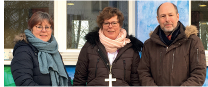
Foto: Bischöfin in der Kita